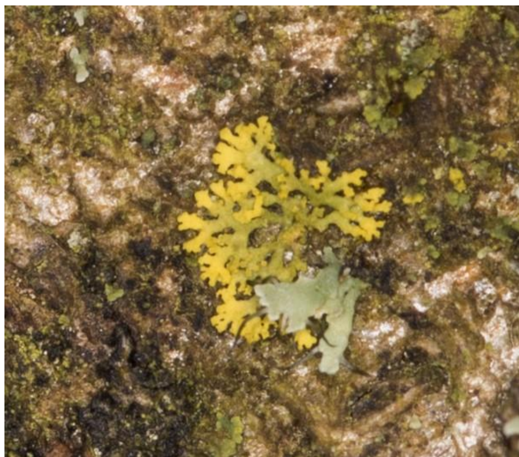
En vals dooiermos