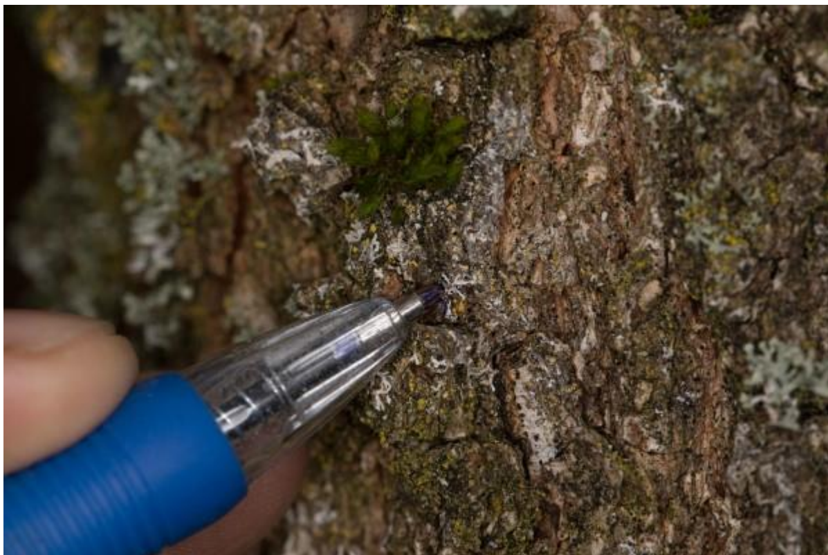
Zo een boomglimschotelje daar moet je oog voor hebben!